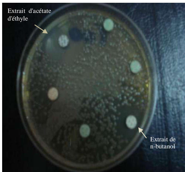
Figure 2.- Activité des extraits du Teucrium polium geyrii sur Proteus mirabilis