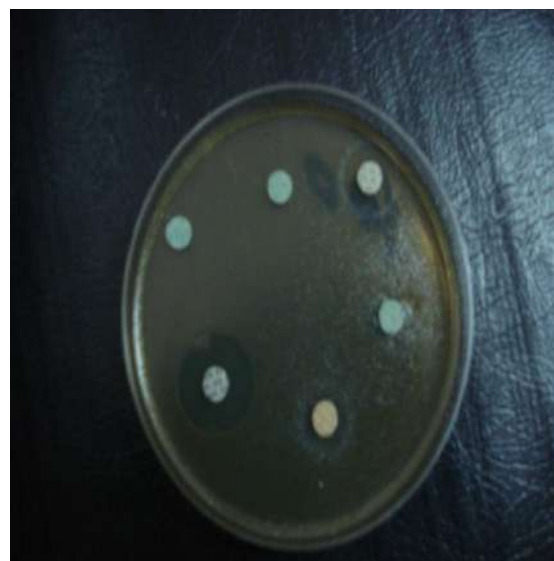
Figure 3.- Activité des extraits du Teucrium polium geyrii sur Klebsilla pneumoniae