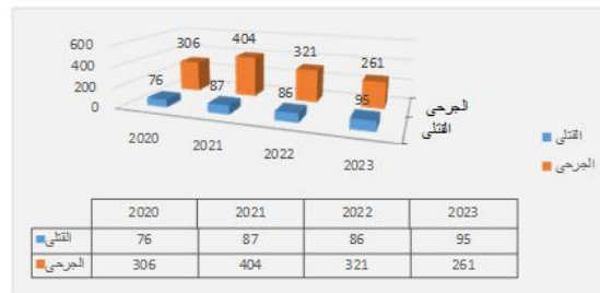
الشكل 02: عدد ضحايا حوادث المرور لسنوات (2020-2023).

المصدر: المجموعة الإقليمية للدرك الوطني لولاية باتنة.2023